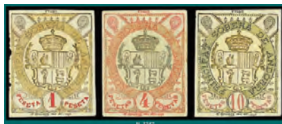
Assajos de segells andorrans de prova de Douchet