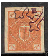
► Foto amb cancel·lació de fantasia sobre un segell original de la sèrie de 1896 de Plácido Ramón de Torres.