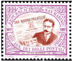
► Segell d'Otto Bickel de San Marino-Philatelist