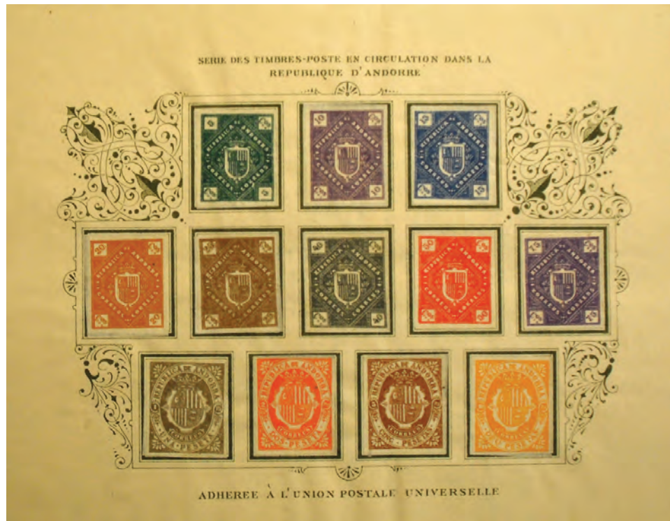
► Sèrie de segells del 29 de setembre del 1896 de Plácido Ramón de Torres